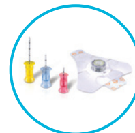
Sets de agujas

*Cada set incluye un set de agujas de calibre 15 estériles EZ-IO®, apósito EZ-Stabilizer®, set de extensión EZ-Connect®, pulsera para el paciente y un recipiente Needlevise® para objetos punzantes