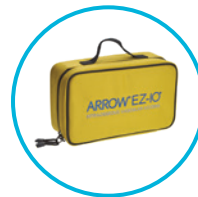
Maletín para paquete de acceso vascular (VAP) EZ-IO® suave (amarillo)