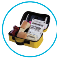
EZ-IO® Kit de capacitación