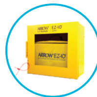
Gabinete de almacenamiento montado en pared EZ-IO®