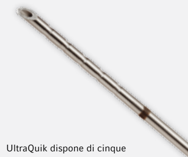
UltraQuik dispone di cinque incisioni ad anello che facilitano l'identificazione della punta dell'ago sotto controllo ecografico