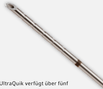
UltraQuik verfügt über fünf eingearbeitete Rillen zur leichteren Identifizierung der Nadelspitze unter Ultraschall