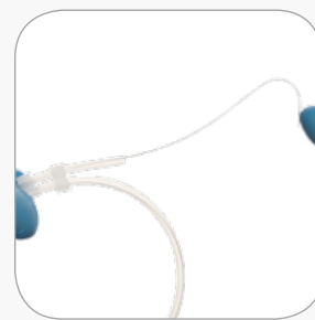
Opções de Fio-Guia