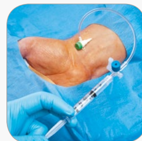
Opções de Acesso