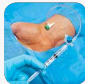
Optionen für den Zugang