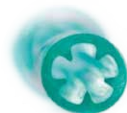
Kuva tähdenmuotoisesta sisälumenistä

Teleflexin DEHP:tä sisältämättömät aerosoli- ja happihoitotuotteet tunnistaa helposti tuotekoodin lopussa olevasta P-merkinnästä*.